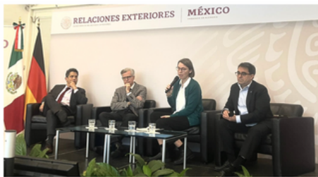
Fortalece CMIC intercambio México-Alemania para acciones medioambientales y de capacitación