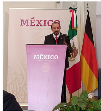
Resaltan en Alemania la importancia de la industria mexicana de la construcción